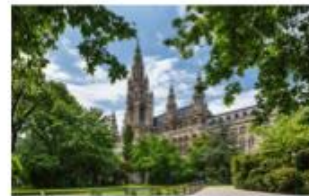
The Vienna City Hall from the perspective of the memorial stone